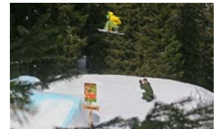
Unknown by Philipp Merki